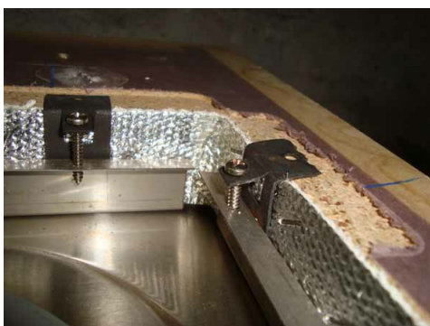
Visualizzazione dettaglio di un tessuto di amianto sotto la copertura di un piano di