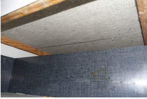
Pannello leggero sotto un piano di cottura, Carbotech