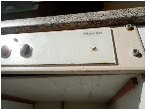
Pannello leggero contenente amianto sotto il piano di cottura.