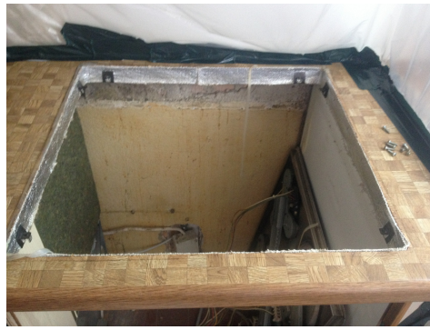
Tessuto di amianto come protezione antincendio e isolamento termico nel piano di cottura.