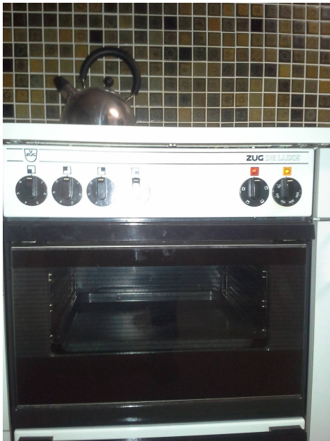
Pannello leggero contenente amianto sotto la piastra di cottura.