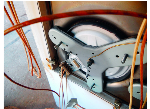
Pannelli leggeri su piano di lavoro in legno sotto il piano cottura