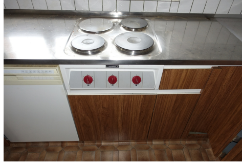
Piano di cottura Prometheus con pannello leggero, Carbotech