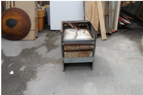
Piano di cottura con rivestimento in amianto.