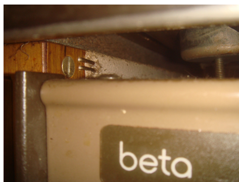
Pannello leggero su legno di un piano di cottura/forno, Carbotech