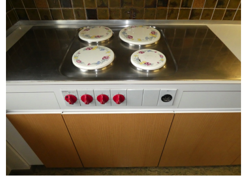
Piano di cottura Prometheus con pannello leggero, Carbotech