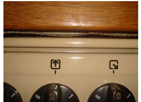
Tessuto di amianto di un piano di cottura, Carbotech