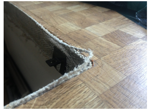
Tessuto di amianto come protezione antincendio e isolamento termico nel piano di cottura.