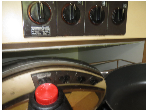
Pannello leggero contenente amianto sotto il piano di cottura. Le pentole nel cassetto sfregano sull'amianto.