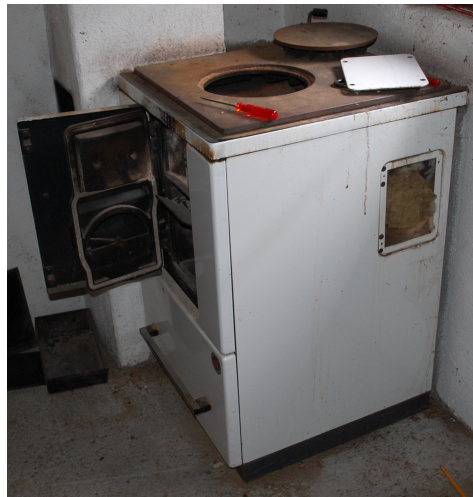
Cucina a legna in un piccolo rifugio con corda di amianto nello sportello e nella parte superiore, sotto il piano di cottura rettangolare, ma non nell'isolamento termico (fibra di vetro).