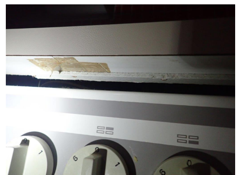
Pannello leggero in un piano di cottura, Gartenmann Engineering