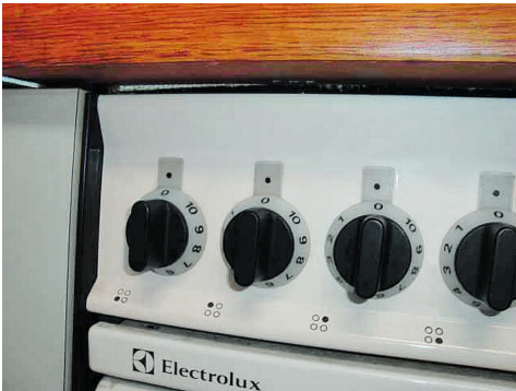
Tessuto di amianto di un piano di cottura