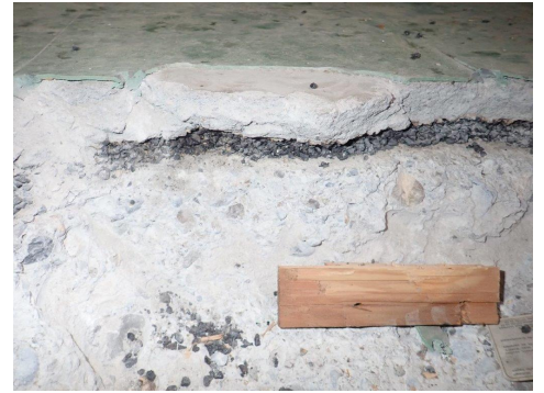
HAP en remblayage sous chape, Gartenmann Engineering