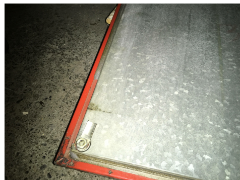
Mousse amiante dans le couvercle d'un monobloc.