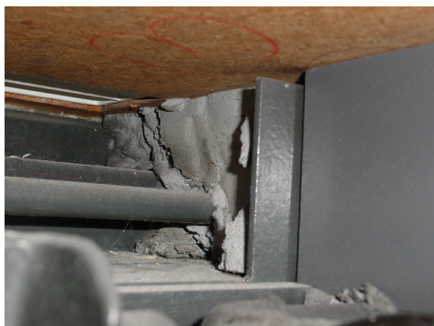
Litaflex comme protection anti-feu autour d'un tube de chauffage.