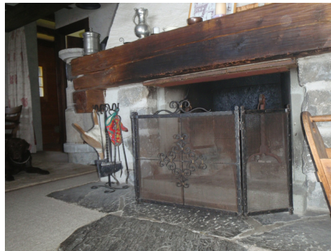
Panneau en fibrociment sous la poutre de la cheminée.