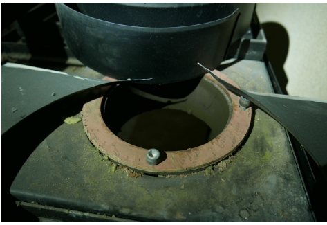
Joint plat amianté d'un four à bois.