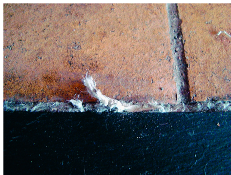
Tresse amiantée dans une cheminée