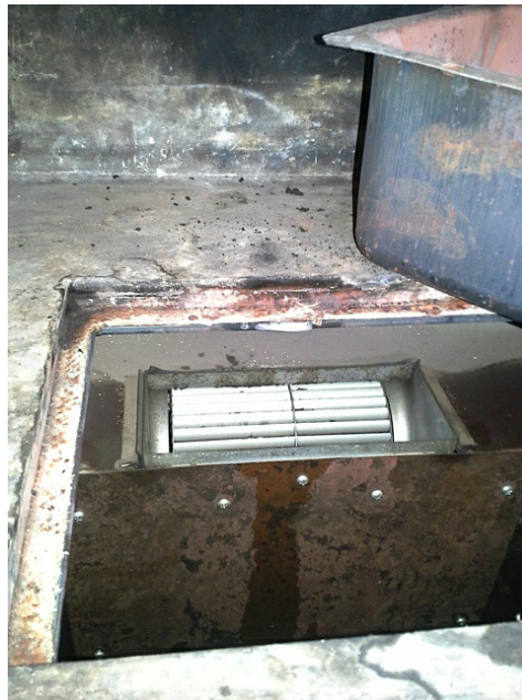
Cheminée avec étanchéité amianté dans bac à cendres.