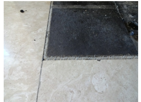
Tresse amiantée entre le foyer et la banquette, Carbotech