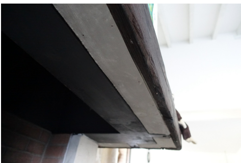
Panneau léger sur la face inférieure de la cheminée, Carbotech