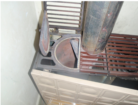
Poêle à mazout avec cordon amianté