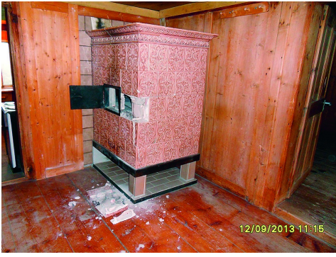
Poêle de faïence