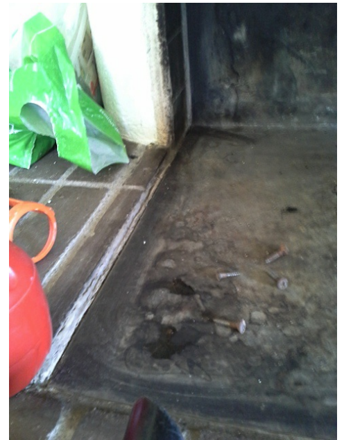
Joint de dilatation amianté