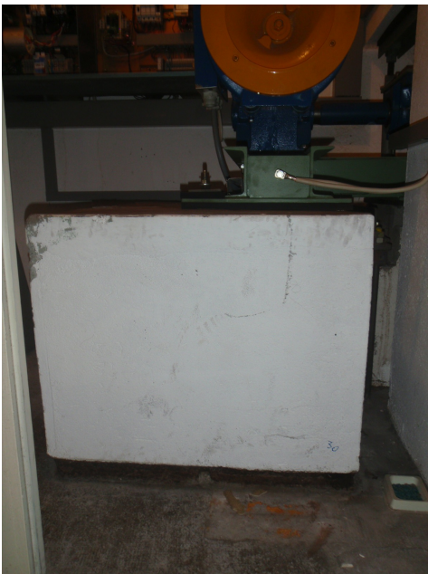
Panneaux en liège bitume dans le socle du moteur d'ascenseur