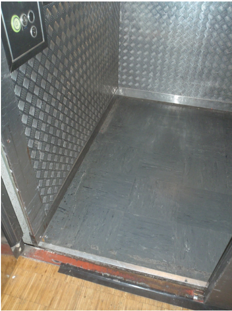
Monte-charge avec revêtement de sol en dalles de vinyle (ici non amiantées).