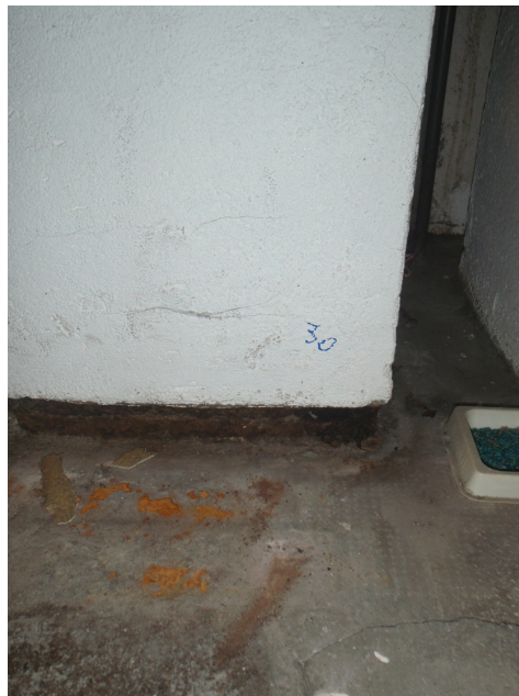
Panneaux en liège bitume dans le socle du moteur d'ascenseur