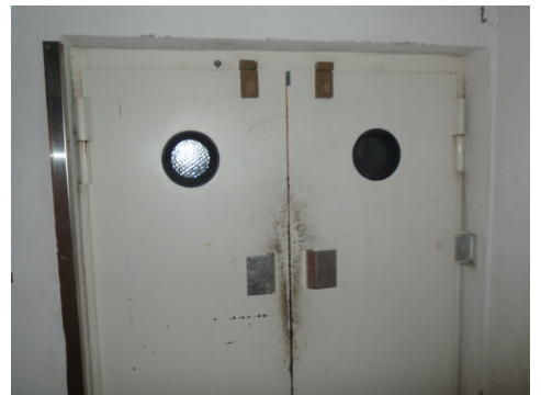
Portes de l'ascenseur avec possible isolation