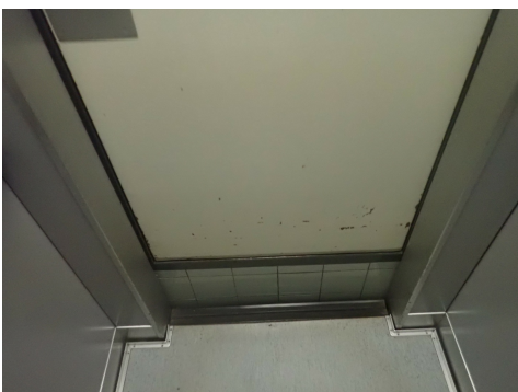
Marquage de l'étage dans la cage de