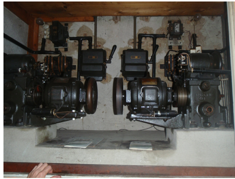
Photo moteur monte / monte charge dans restaurant. Les plaquettes de frein sont potentiellement amiantés.