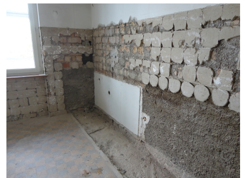
Les «plots de mortier» sont généralement considérés comme non amiantés, selon l'état actuel des connaissances; il n'est donc pas nécessaire de prélever des échantillons.