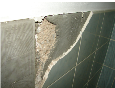
Colle de carrelage en couche épaisse, photo: Carbotech AG.