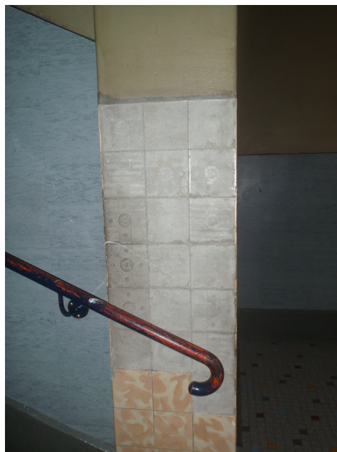
les carreaux se sont détachés et que la colle est en mauvais état, il peut y avoir un certain risque même en cas d'utilisation normale des locaux.