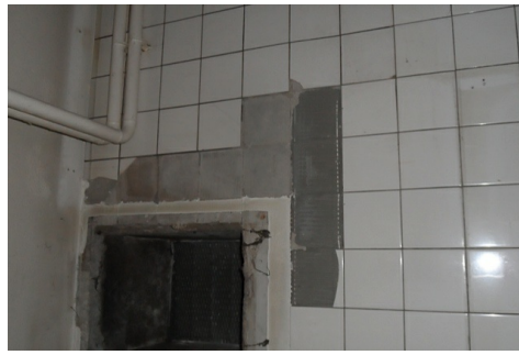
Colle de carrelage contenant de l'amiante – plusieurs colles différentes peuvent être dissimulées derrière les carreaux.