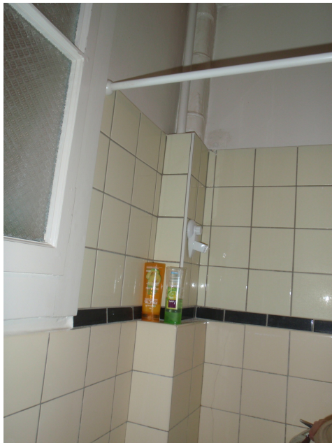
Carrelage rénové au-dessus d'une baignoire, SCS