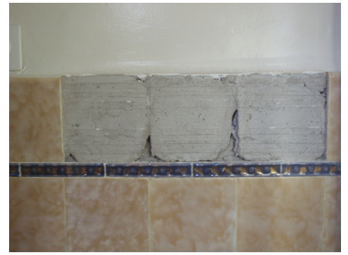
Mortier sous faïence, appliqué en couche épaisse; selon l'état actuel des connaissances, ne contient généralement PAS d'amiante et ne fait qu'exceptionnellement l'objet de prélèvement d'échantillons.