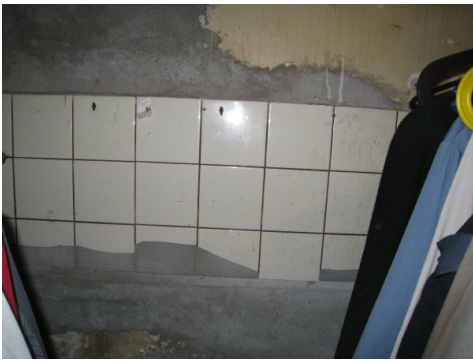
Colle de carrelage contenant de l'amiante - traces de la truelle crantée dans la colle